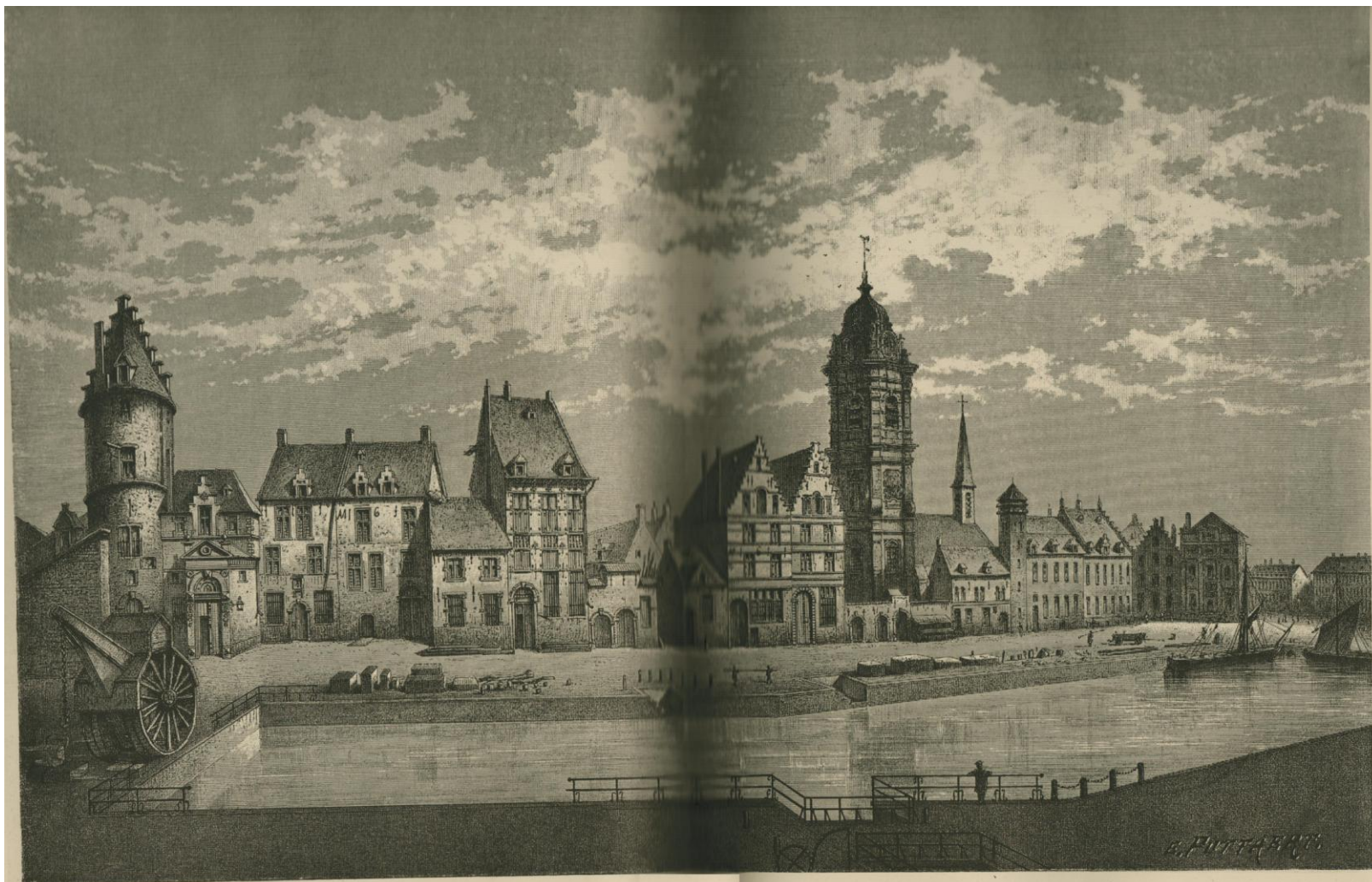
LE QUAI AU SEL A BRUXELLES EN 1732. — Vue prise depuis l'endroit nommé la Tour jusqu'au coin du Marché-aux-Grains. Dessin de E. Puttaert, d'après l'original fait par lui-même de la collection de S. A. S. le duc d'Arenberg.